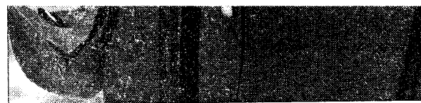
Povia durante l'ultima fortunata esibizione sanremese